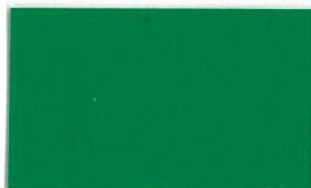
T-09 フォレストグリーン [透光率:0.2%]