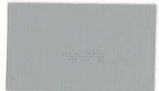
T-19 グレー [透光率:0.4%]