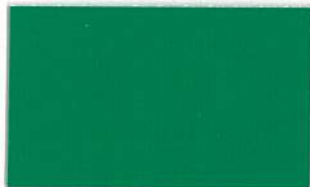
T-07 グリーン [透光率:0.1%]