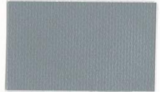
T-21 シルバー [透光率:0%]