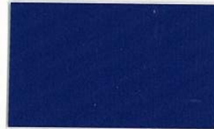
T-50 ダークパープル [透光率:0%]