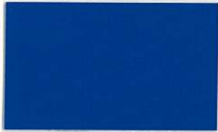
T-01 ロイヤルブルー [透光率:0%]