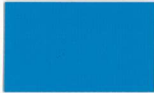
T-02 ライトブルー [透光率:0.1%]