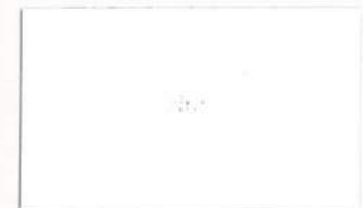
T-18 ホワイト [透光率:4.9%]