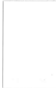
高透光ホワイト [透光率:10.0%]